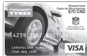
Illustration de la carte prépayée à titre d'exemple seulement. La carte reçue peut être différente de celle représentée ici.

Pour vérifier le statut de votre réclamation: www.NokianTiresRebates.ca .